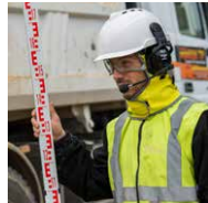
Kopf-, Augen-, Gesichts- und Gehörschutz