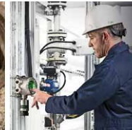
Stationäre Flammen- und Gasedektion